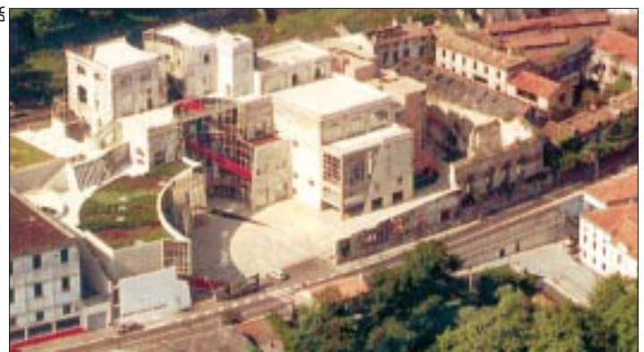
Un univers dédié à l'image.