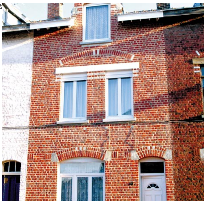
Réhabilitation de l'habitat traditionnel par la Sem Ville Renouvelée