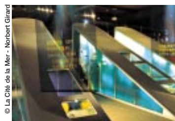
La gare maritime transatlantique : vue intérieure.