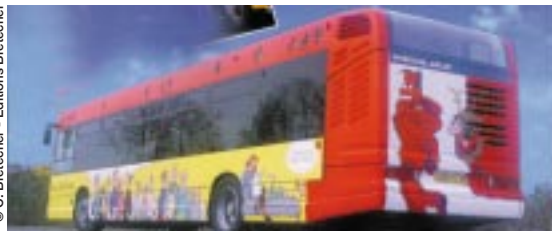
Les 96 véhicules de la STGA transportent chaque année

Avec Handibus, service pour personnes à mobilité réduite, Locabus, service location de minibus sans conducteur pour petits groupes, Scoti qui permet