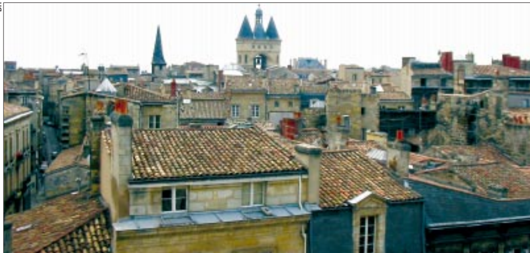
Restructuration sur 220 hectares dans le centre historique de Bordeaux.

C'est dans le cadre d'un projet global de restructuration, sur 200 hectares dans le centre historique de Bordeaux, qu'intervient In Cité, avec une mission de requalification lourde du logement, confiée par la ville en convention publique.