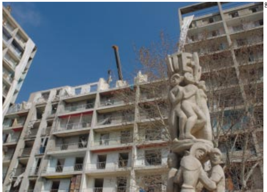
Le bâtiment C illustre la requalification du parc : la moitié des logements entièrement réhabilitée, l'autre détruite.