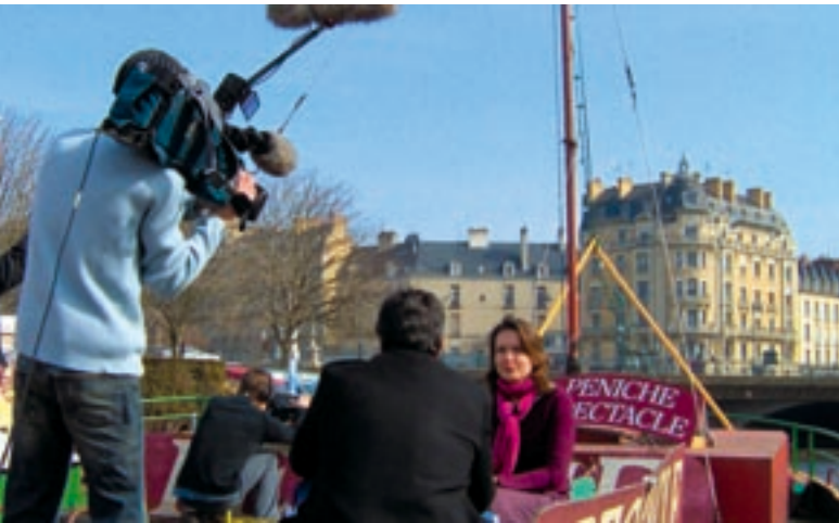
TV Rennes : tournage de l'émission « Cécute » sur la période spectacle.