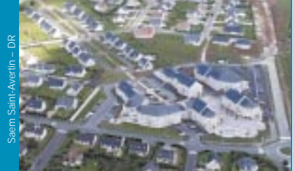
Saem Saint-Avertin

Comme chaque année depuis 1991, la Fnsem organise le concours des Sem d'or qui vise à mettre en valeur la performance des Sem au service des collectivités locales dans leurs trois secteurs d'activités.