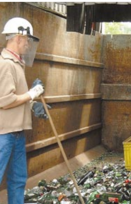
Triselec - DR

Cette Sem qui gère l'Office de Tourisme, le port de plaisance et qui assure la promotion des produits régionaux (dont le vin bien sûr, puisque le vignoble de Pauillac affiche 18 crus classés sur les 60 que compte le Médoc), a démarré en début d'année son grand chantier de préparation de certification (norme AFNOR NF X50-730), spécifique aux Offices de Tourisme. Même si la consécration ne doit intervenir qu'en fin d'année, la tendance est fortement à l'optimisme.