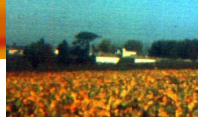
Maison du Tourisme et du Vin de Pauillac - DR